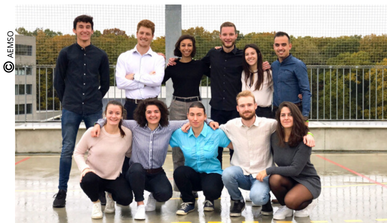
AEMSO, l'association porteuse du projet Paris-Saclay Games